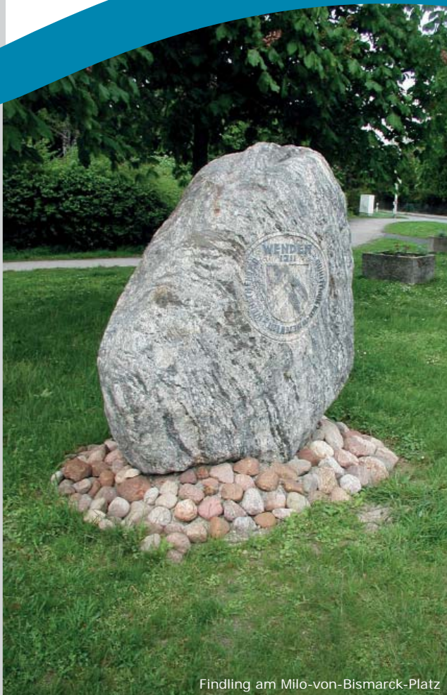
Findling am Milo-von-Bismarck-Platz