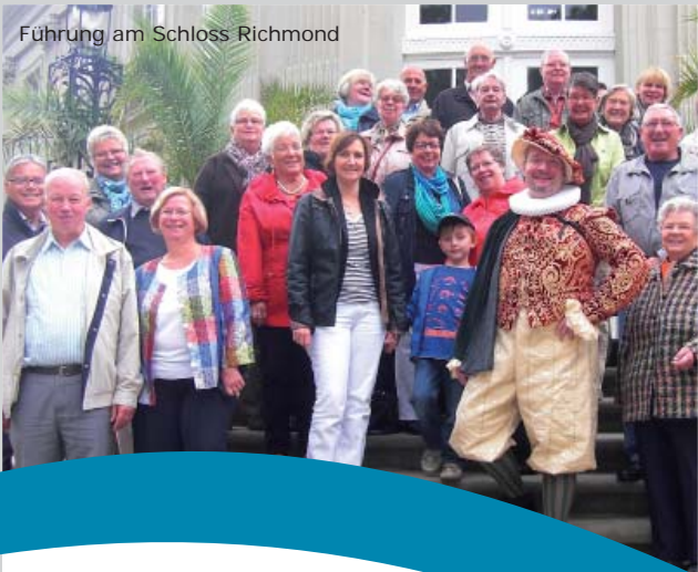
Führung am Schloss Richmond