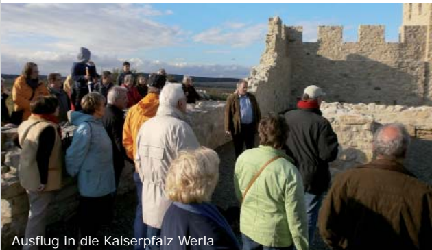
Ausflug in die Kaiserpfalz Werla

Sowohl in unseren Archiv- und Vereinsräumen, als auch bei den unterschiedlichsten Besichtigungen, Vorträgen und Führungen, pflegen wir das gemeinschaftliche Miteinander.